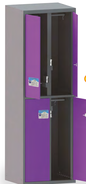
ШО 4-E (HPL)