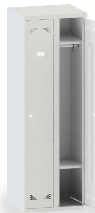
ШО 2 с полками для обуви и инфо-окнами