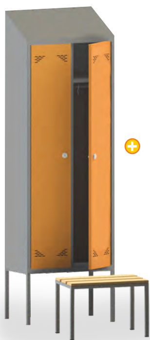
ШО 2ПНК с приставной скамьей