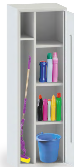
ШМУ (шкаф для хозяйственного инвентаря)