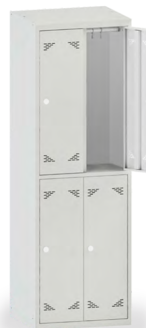
ШО 4 (без полок)