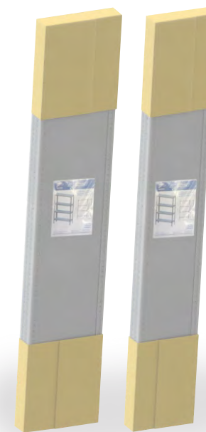
САМ стеллажи производства ООО «ЭКОМ» в упакованном виде для продажи в розничных сетях