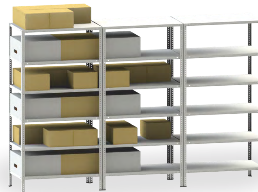
САМ стеллаж 2,0/1,0x0,6/200/6 - 3 комплекта