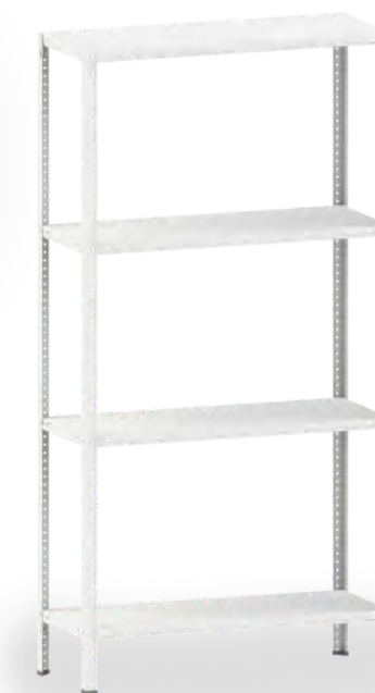
САМ стеллаж 2,0/1,0x0,4/300/4